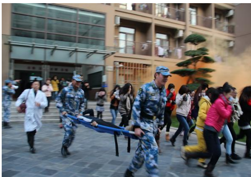
(高层学生宿舍楼消防逃生演练)

年新生入校 下发人手一 本《上海市大 学生安全教 育读本》。 2013 年 9 月 30 日上午 10 点至 11 点, 嘉定人民广 播电台《民生 热线》